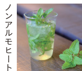
ノンアルモヒート