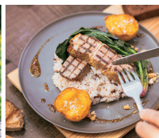
左から、かき氷500円～、弓豚のグリエ1,450円