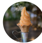
茨城メロンのソフトクリーム

地元の旬のフルーツを使ったドリンクメニューが味わえるカフェでは、茨城メロンを使ったソフトクリームが登場！園内のミントを使った爽やかノンアルモヒートも夏のおすすめ！ご賞味ください。