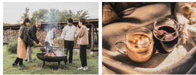
焚き火グルメやホットドリンクも販売中

[束] ランチセット 5品セット ¥2,090 ~ ・弓豚ロースのグリエ (+200円) ・10時間煮込んだミートパイ (+100円) ・オリジナル欧風スパイスカレー [提供時間] 11:00 - 15:00 (L.O.)