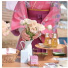
物販や軽食を販売