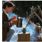
焚き火コーヒーなど