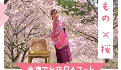
着物でお花見&フォト

山頂のグランピングエリアにて着物や袴の着付け&レンタルを実施。日にち限定で中村写真館のワンコインフォトも実施！河津桜を背景に和装フォトを。